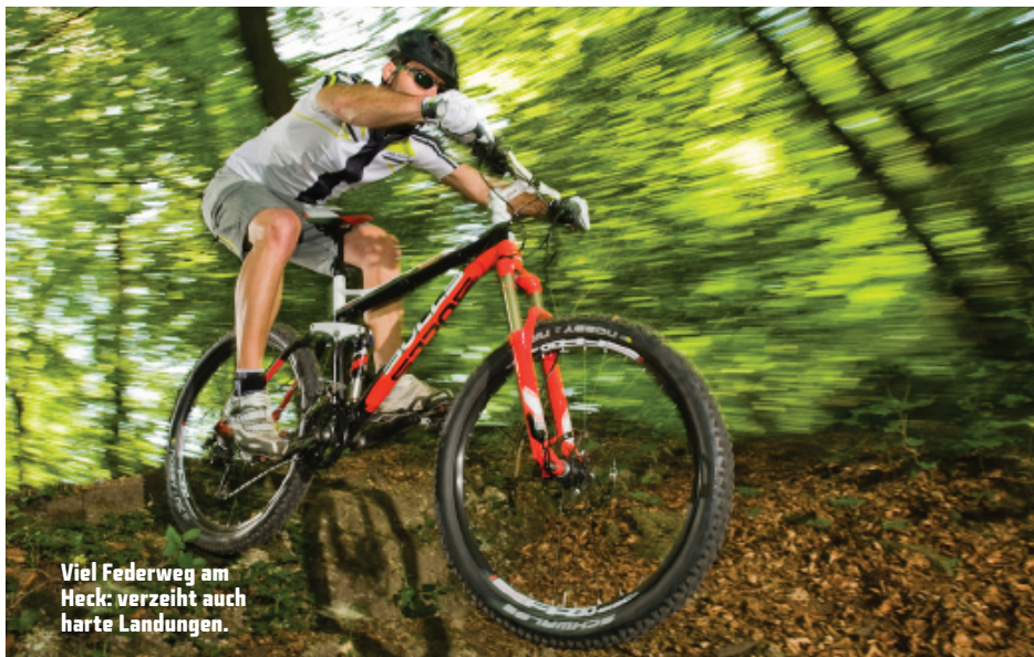
Viel Federweg am Heck: verzeiht auch harte Landungen.