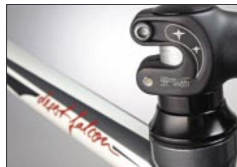
Der kräftige ITM-Vorbau umschließt sicher den Aluschaft der Gabel.