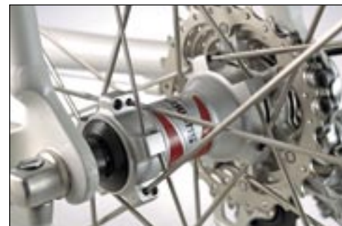
Feine Technik von Shimano: Der Lauf-radsatz WH-RS10.

Keiner der weiteren Hersteller im Test setzt auf einen solch enormen Radstand wie die Herren von Bulls. 1 025 Millimeter bei einer Unterstrebenlänge von 410 Millimetern führen zu limousinenartigem Gleiten. Dank komfortablem, aber nicht unsportlichem Sattel und einer sportlichen, aber nicht zu gestreckten Haltung liefert das Desert Falcon hohen Komfort und fühlt sich auf langen Strecken pudelwohl. Es nimmt aber auch gerne einen aggressiven Stil an. Antrittsstabil und durchaus reaktionsfreudig fetzen Sie sicher um jede Kurve, müssen im Anschluss die neun Kilogramm aber mit viel Kraft wieder auf Tempo bringen. Aber egal, wenn Sie vergleichen, was die anderen Teilnehmer auf die Waage bringen, dann sind glatte neun Kilo für die Preisklasse völlig in Ordnung. Mehr als nur in Ordnung ist die Ausrüstung, die am Desert Falcon für die 1 000-Euro-Klasse verbaut wurde: eine komplette Ultegra mit niegelagelten Lauf-rädern namens WH-RS10 ebenfalls von Shimano und soliden Bauteilen von ITM. Das ist eine Ansage, bei der kein anderer Hersteller Kontra geben kann. Unter www.radsport-rennrad.de finden Sie eine Liste mit allen angeschlossenen Radhändlern in Deutschland.